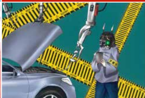
2021年JAMCA PRIZE 受賞作品